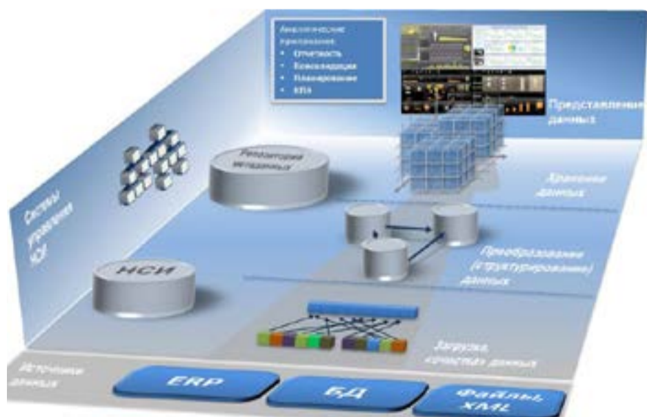
Рисунок 1. Схема «классического» BI-решения