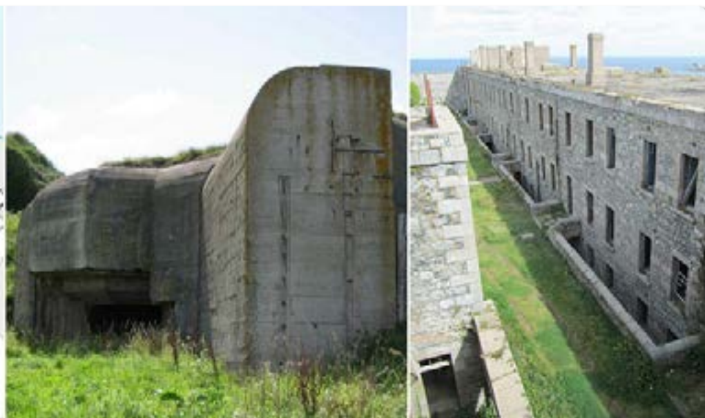
Построенные фашистами укрепления до сих пор сохранились на острове Олдерни