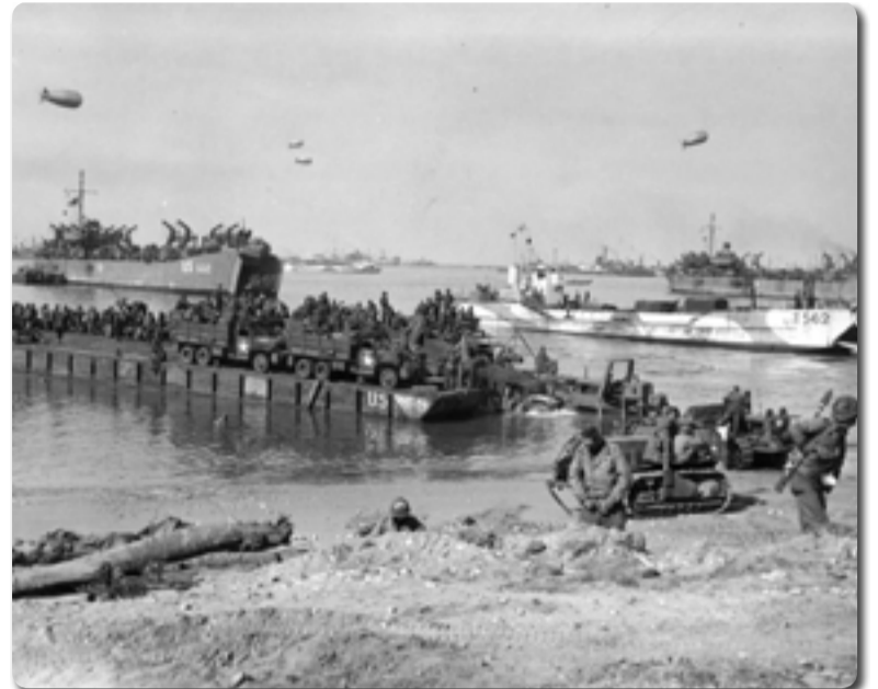
Высадка союзников в Нормандии

- Иду по городу, кругом немцы. Я случайно оказался перед фельд-жандармерией, где проверяли документы. Я не мог повернуть обратно, они бы меня арестовали. Но тут я увидел, что передо