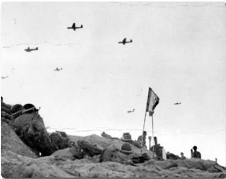
Высадка союзников в Нормандии